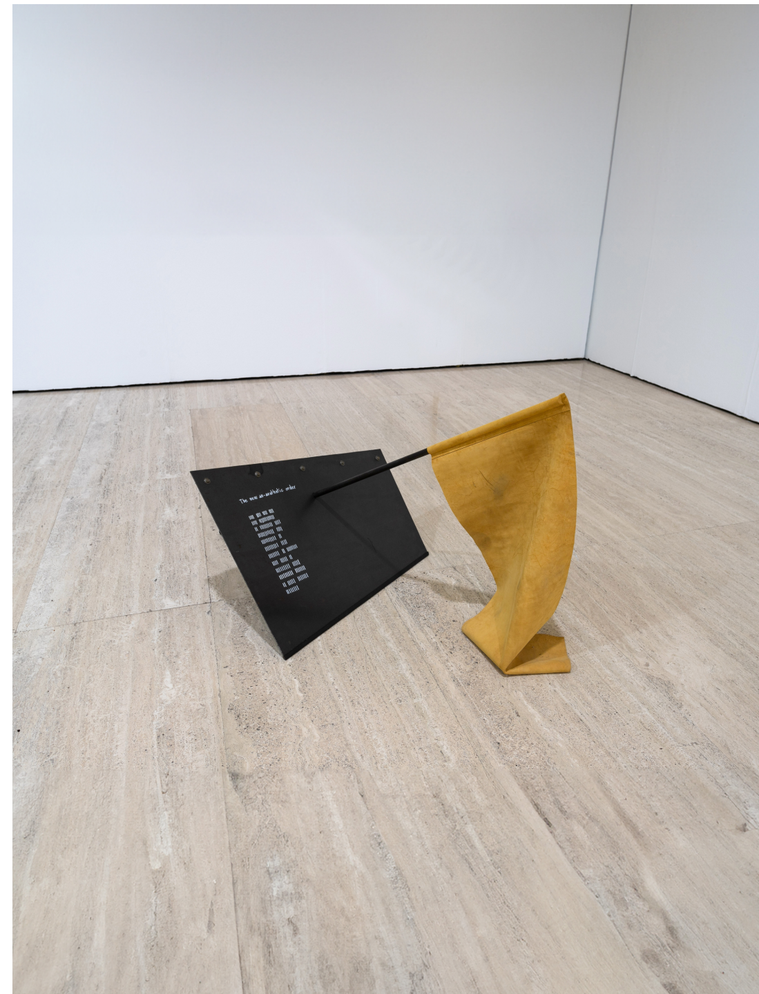
Dies irae, 2019 84 x 92 x 153 cm