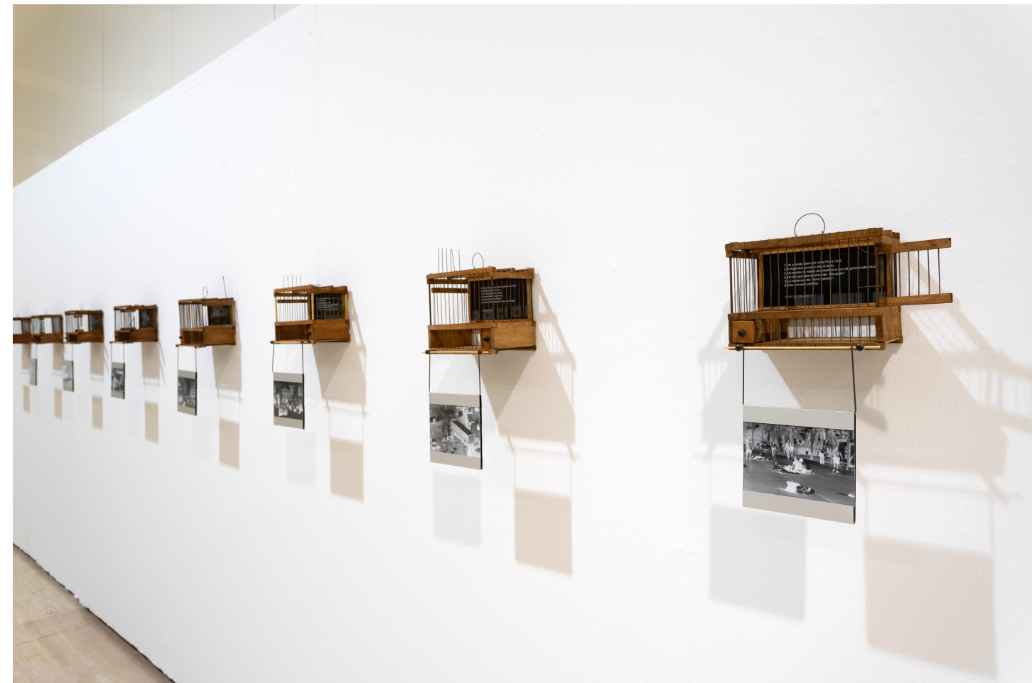
The anarchy heavy wings, 2018 50 x 21 x 14,5 cm;