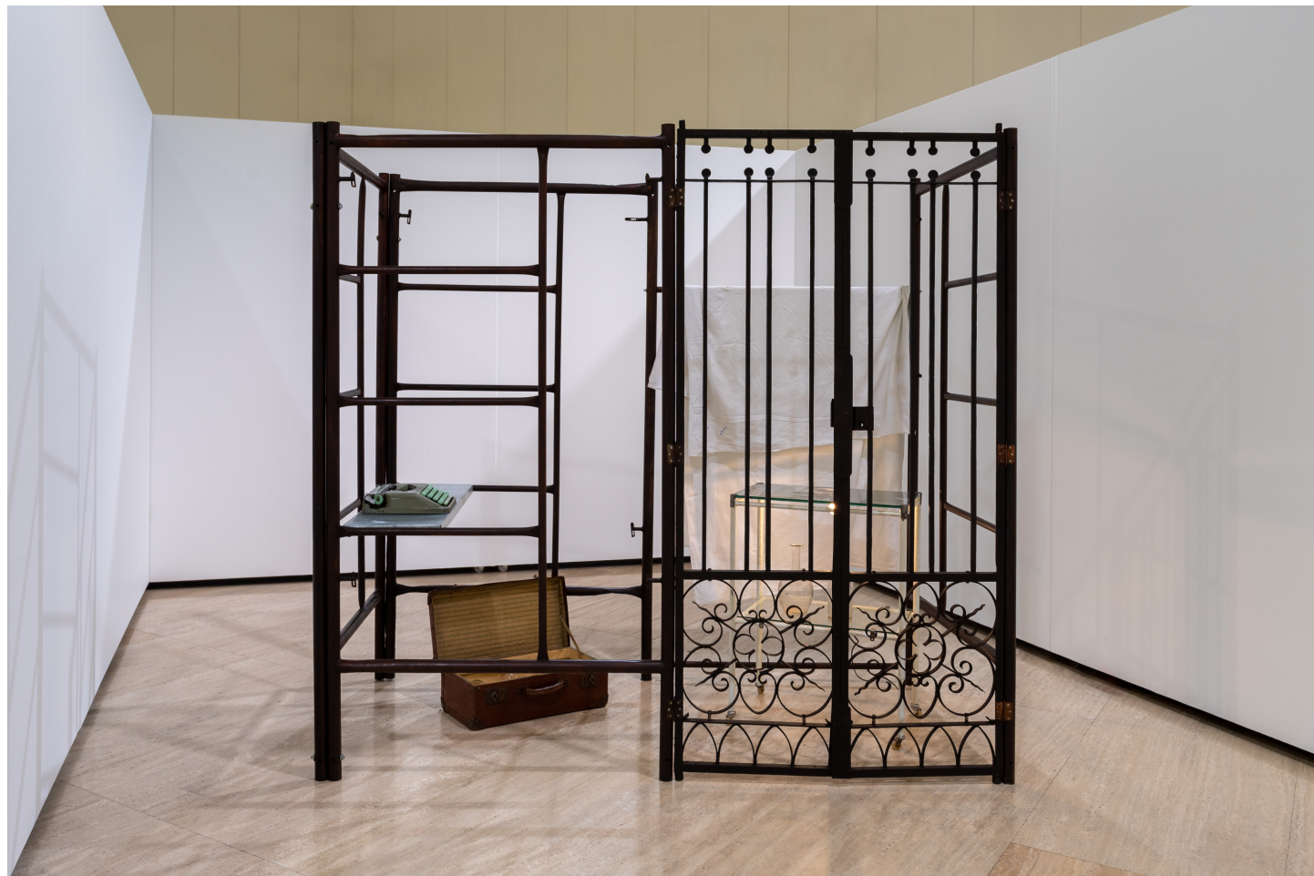
La celda del coleccionista, 2022 (La celda del collezionista) 200 x 214 x 108 cm