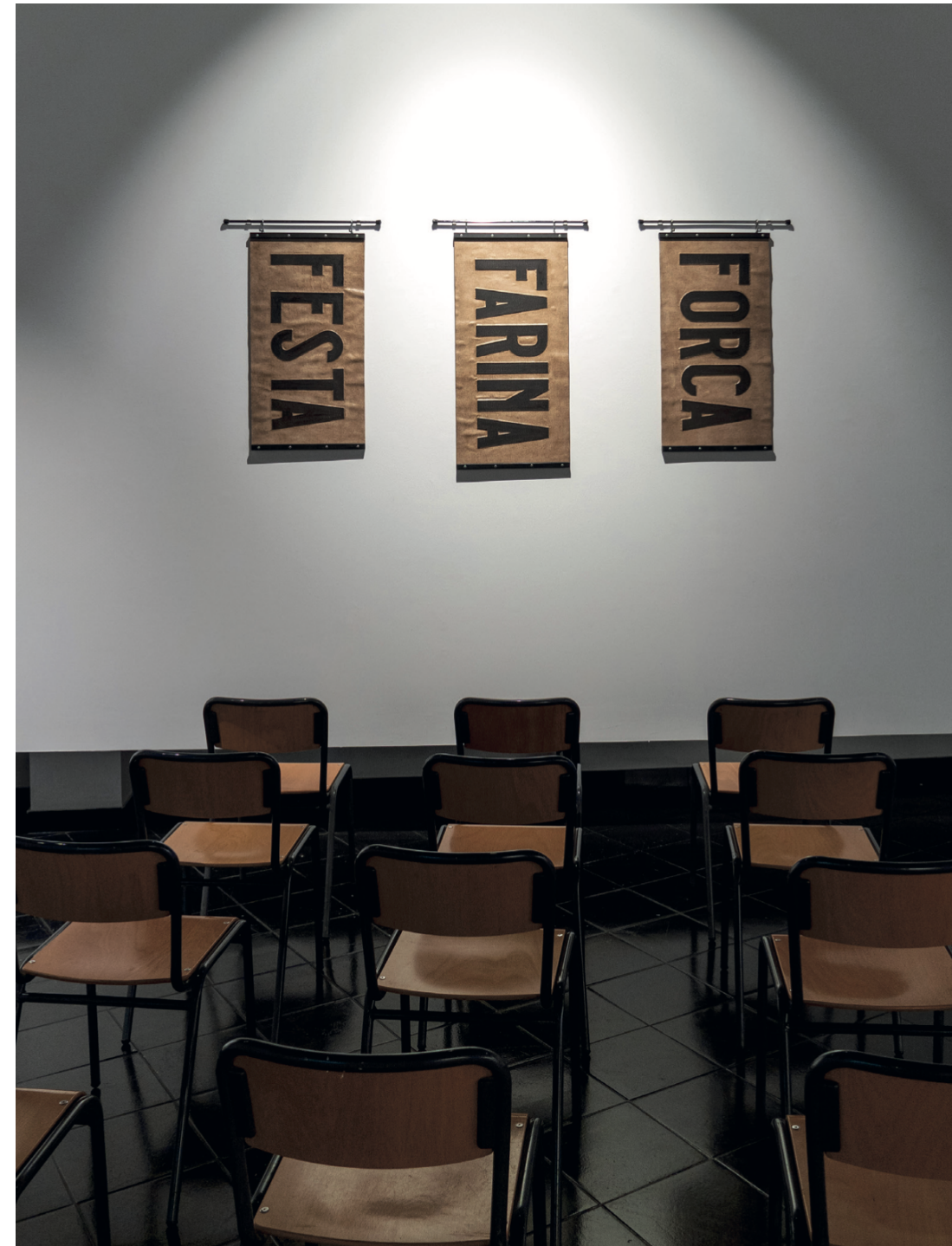
Festa, Farina, Forca, 2021 245 x 224 x 330 cm