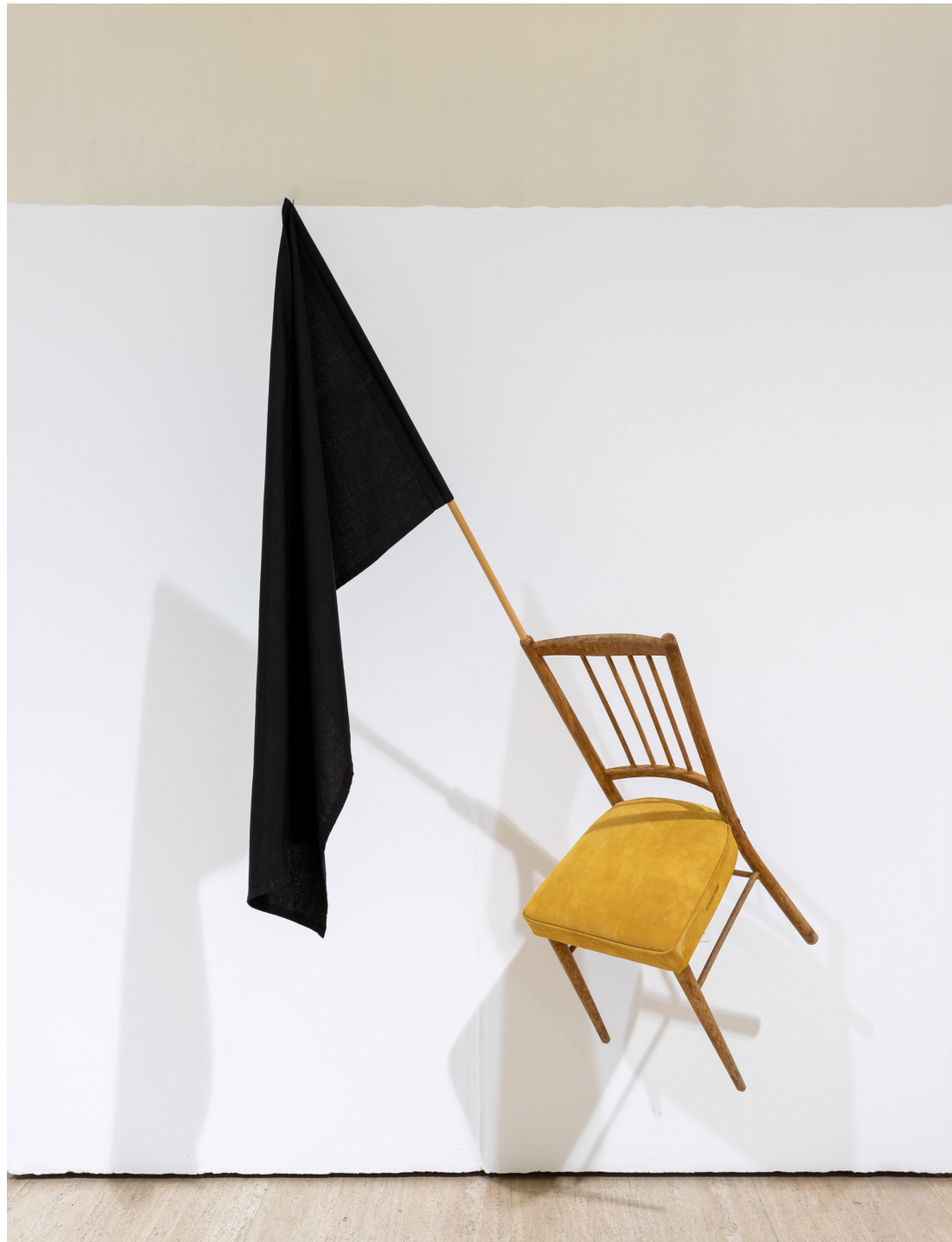
Kommt Zurück, 2020 (Tonerai) 223 x 122 x 83 cm