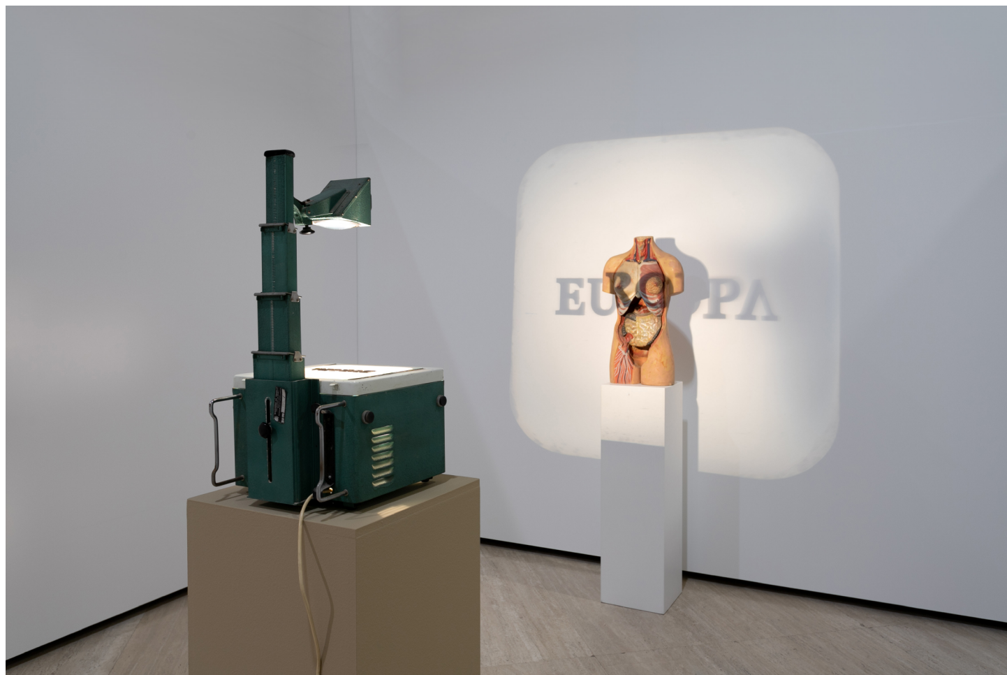
Europa, 2020, installazione proiettore di lucidi, manichino anatomico, legno