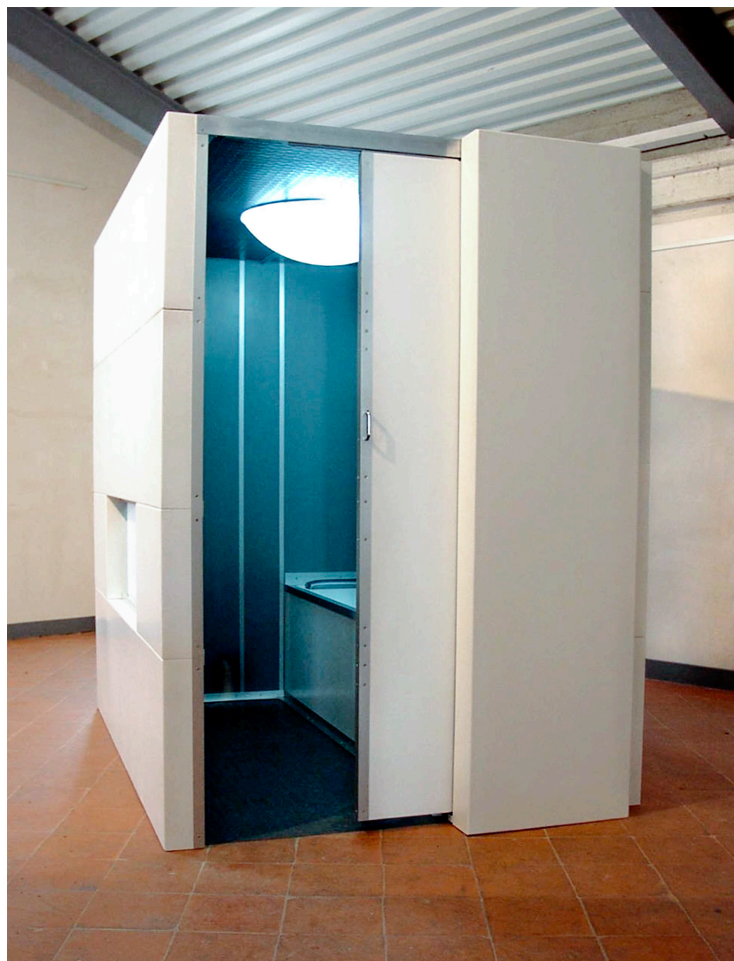
Stasi (bunker del pensiero), 2002 191,5 x 140,5 x 198,8 cm