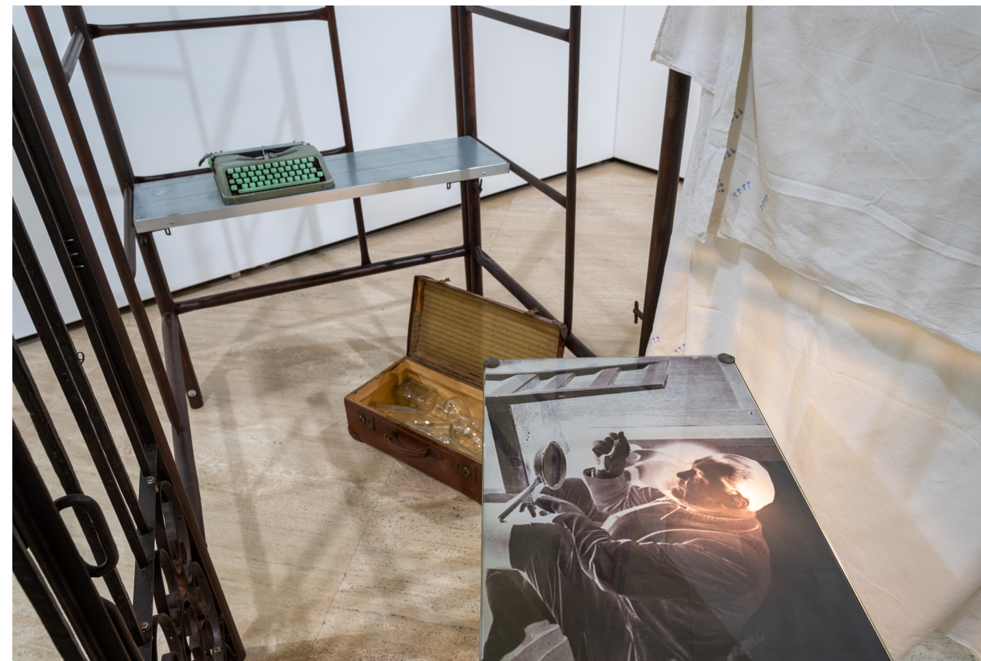
La celda del coleccionista, 2022 (La celda del collezionista - particolare) 200 x 214 x 108 cm