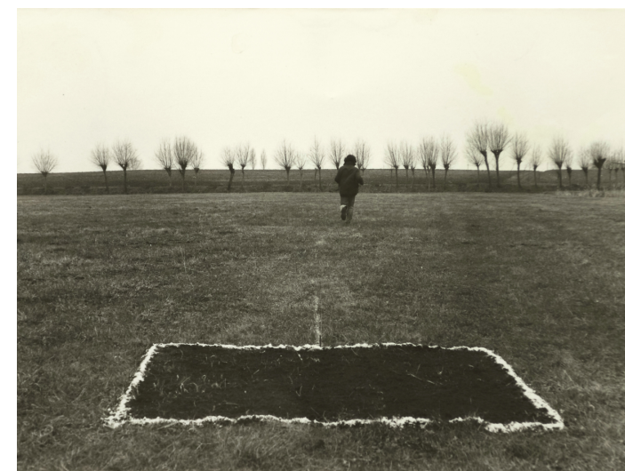
Elevazione, 1978 8,8 x 12,6 cm