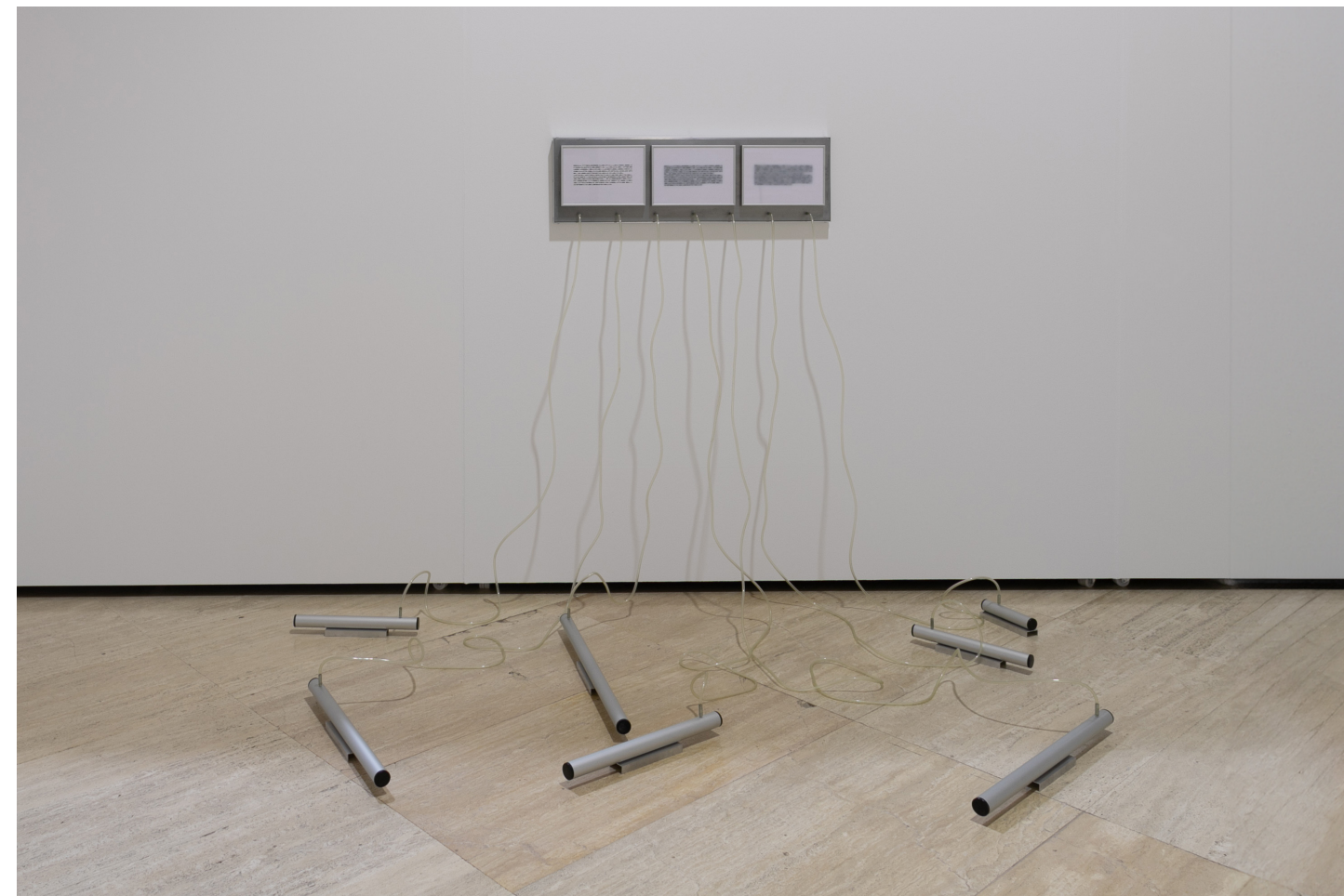
Demokratie, 2003 166 x 243 x 153 cm