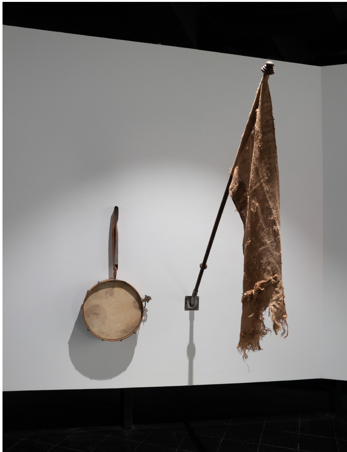
Tamburo di guerra, 2021 255 x 100 x 175 cm